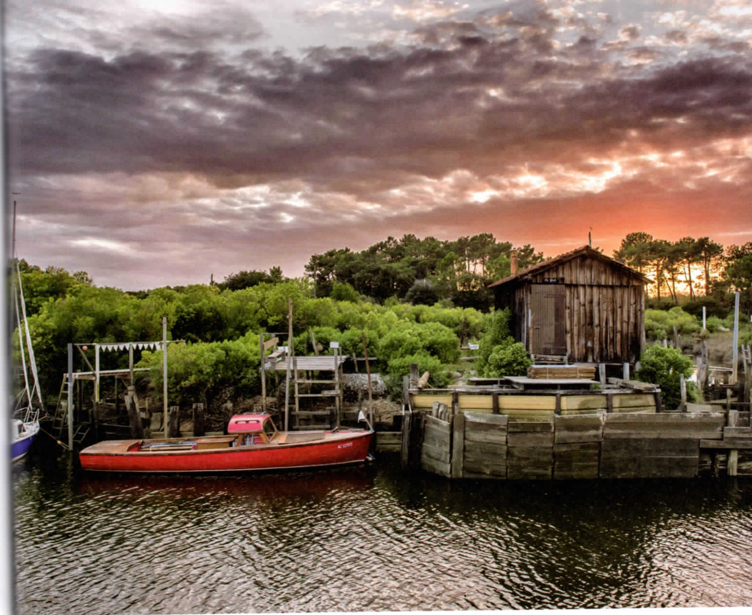
GUJAN-MESTRAS village ostréicole du Bassin, compte pas moins de... sept ports